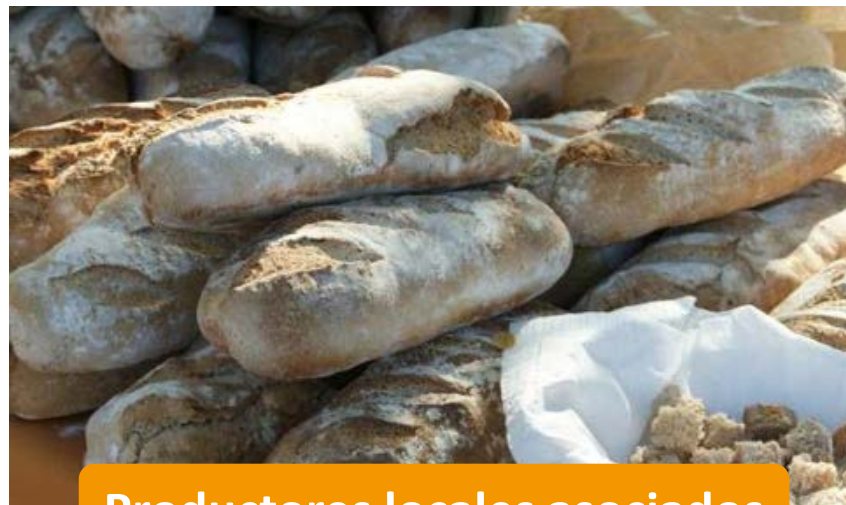
Productores locales asociados