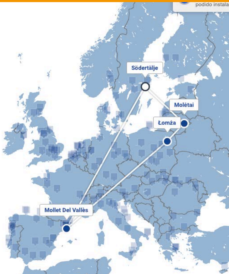
Diet for a Green Planet 2014-16