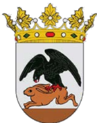
Ayuntamiento de Corella