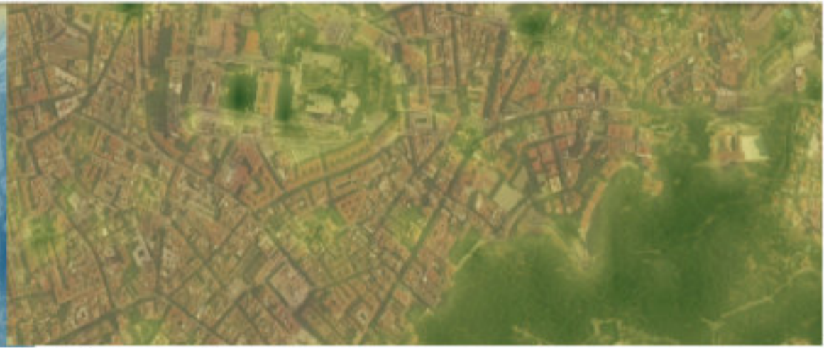
Calidad zonas verdes