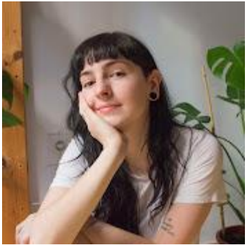
Luca B Art