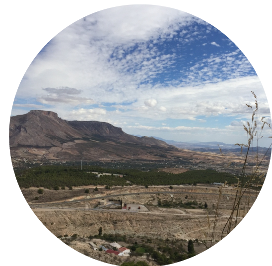
Restauración de zonas naturales