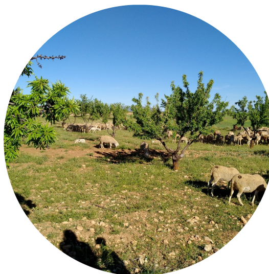
Transición hacia la agricultura regenerativa