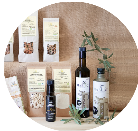
Desarrollo de casos de negocio 4retornos