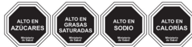
Etiquetado Nutricional de Alimentos / Ministerio de Salud de Santiago de Chile