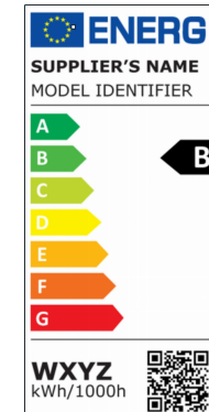
Etiquetado de eficiencia energética europea