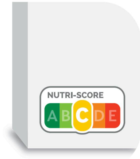
Nutri-Score / Sistema de etiquetado nutricional europeo