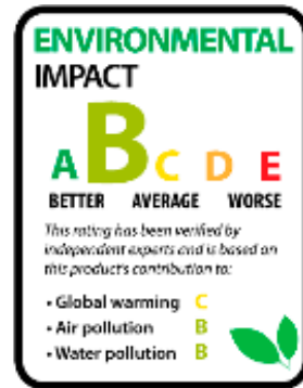
Etiquetado europeo Huella Ambiental de Producto (HAP)