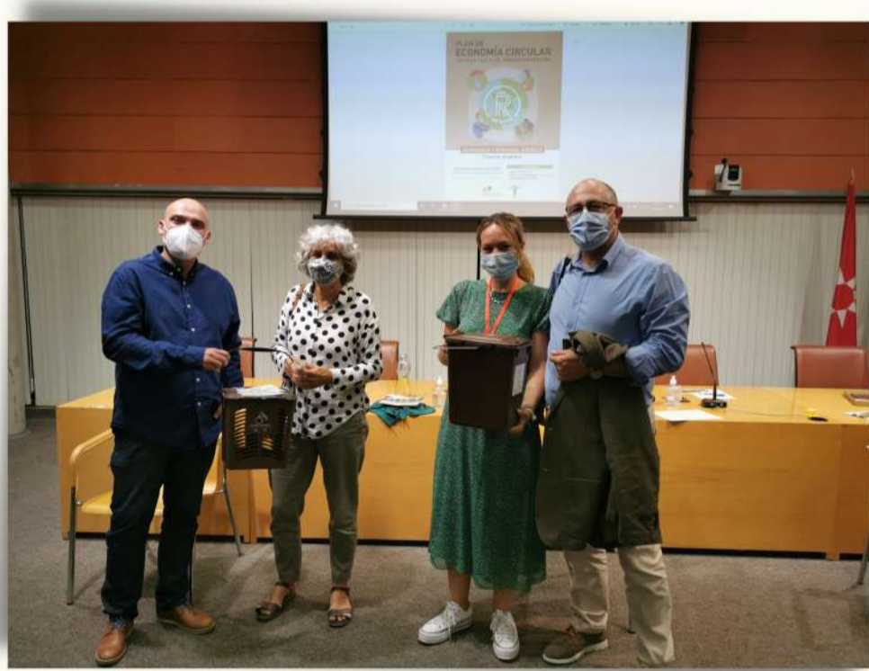
Jornada expertos fracción orgánica