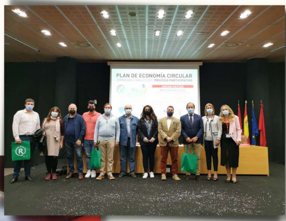
Jornada partidos políticos

A través del proceso participativo del Plan de Economía Circular "con R de Rivas" se han desarrollado 12 jornadas en las que han participado más de 400 personas.