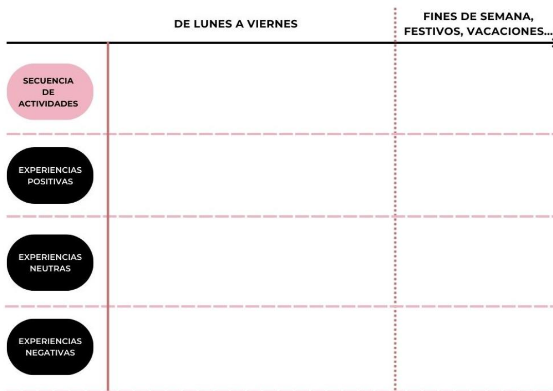
Figura 6. Panel de ruta de experiencia de usuario. (Basado en el Customer Journey Map )

PARTICIPACIÓN CIUDADANA EN EL DISEÑO DE PLANES DE ACCIÓN DE AGENDAS URBANAS A TRAVÉS DE LA COCREACIÓN Y EL DESIGN THINKING. EL EJEMPLO DE LA AGENDA URBANA DE PEÑAFIEL (VALLADOLID).