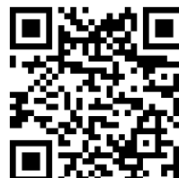
Figura 1. Acceso a ejemplos de vídeos de las convocatorias de las jornadas de participación ciudadana de la Agenda Urbana de Peñafiel. (Ayuntamiento de Peñafiel)