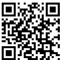
Figura 9. Acceso al vídeo resumen de las jornadas de participación de la Agenda Urbana de Peñafiel.

Finalmente, el plan de acción de la Agenda Urbana de Peñafiel, aprobado por su pleno el 8 de septiembre de 2022, está, inicialmente, conformado por un total de 84 proyectos, distribuidos en 7 programas y 49 actuaciones. El 42% de los proyectos surgen directamente de los problemas identificados y las ideas generadas por la ciudadanía en estas jornadas de participación.