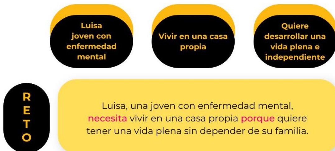
Figura 8. Ejemplo de definición de reto. (Elaboración propia)

En cuanto a la cumplimentación del panel, es importante que se tenga claro a qué nos referimos con el insight . Este concepto responde a hechos claves, inesperados y que aportan valor, tanto en la formulación del problema como de la futura solución, que se diseñe. Se trata de revelaciones, que dan visibilidad y claridad a información oculta y que tienen que servir de palanca para que las ideas y las innovaciones broten espontáneamente en la siguiente fase.