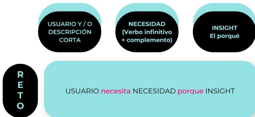
Figura 7. Panel definición de reto. (Elaboración propia. Basado en Método How Might We...? )

PARTICIPACIÓN CIUDADANA EN EL DISEÑO DE PLANES DE ACCIÓN DE AGENDAS URBANAS A TRAVÉS DE LA COCREACIÓN Y EL DESIGN THINKING. EL EJEMPLO DE LA AGENDA URBANA DE PEÑAFIEL (VALLADOLID).