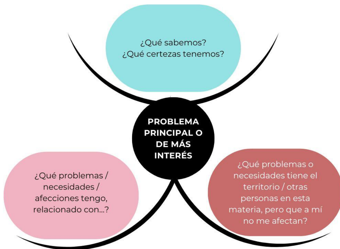
Figura 4. Panel de preguntas detonantes. (Elaboración propia)