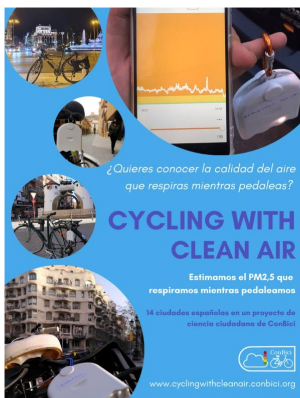
Figura 9. Infografía del proyecto Cycling With Clean Air.

Esta iniciativa de ciencia ciudadana aportará más información sobre la calidad del aire de sus centros urbanos y facilitará el desarrollo de planes de movilidad sostenible y definición de zonas de bajas emisiones. Asimismo, ConBici difundirá los datos obtenidos a la ciudadanía, ONGs ambientales y agentes sociales, a través de los medios de comunicación y redes sociales.