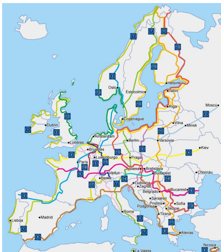
Figura 4. Mapa de las rutas EuroVelo actuales. (EuroVelo)

Visibilización de la brecha de género en la bicicleta