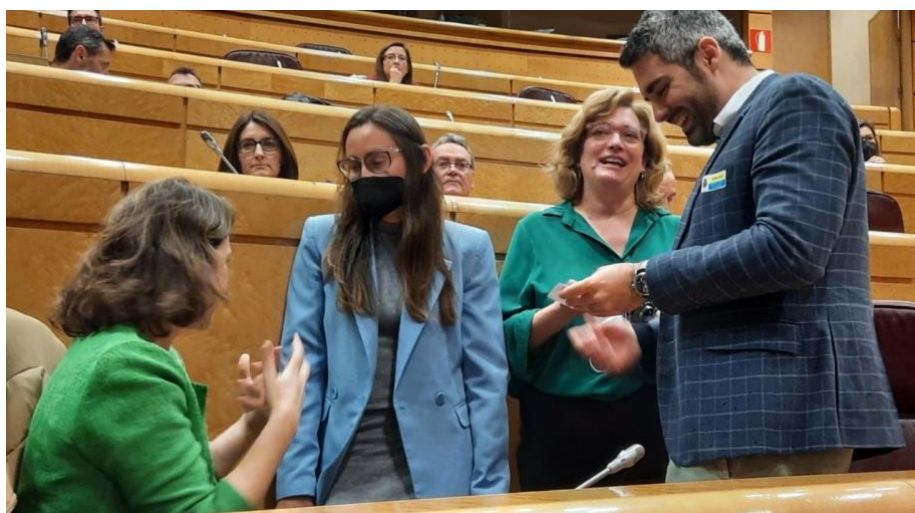
Figura 2. Miembros de ConBici tras una comparecencia en el Senado.

Las principales funciones de la organización consisten en la representación institucional de ConBici con las administraciones públicas, en actos y medios de comunicación, y fortalecer las relaciones institucionales en diferentes niveles. En este sentido tenemos contacto con los Ministerios de Transición Ecológica, Agricultura, Movilidad y Derechos sociales, con la Dirección General de Tráfico, la Red de Ciudades por la Bicicleta, el Congreso de los Diputados o el Senado entre otros.