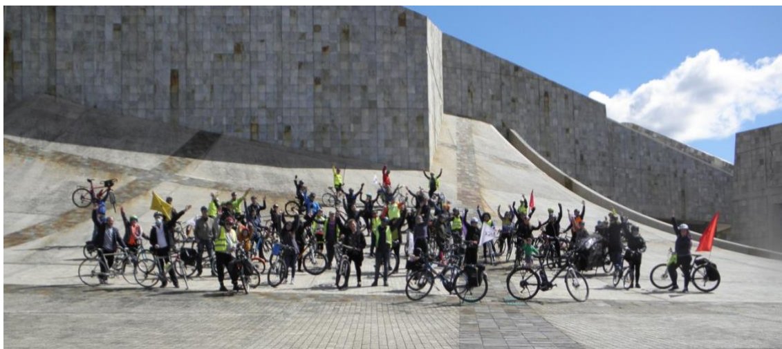
Figura 1. Miembros de ConBici tras la reunión anual de 2022.

Finalmente realizamos diversos proyectos con financiación europea y estatal para la difusión de los beneficios de la bicicleta, a destacar Cycling With Clean Air. Se trata de un proyecto de medida de la calidad del aire en 14 ciudades con personas voluntarias que llevan un medidor en su bicicleta durante sus viajes diarios, el cual pone en valor la necesidad de las zonas de bajas emisiones.