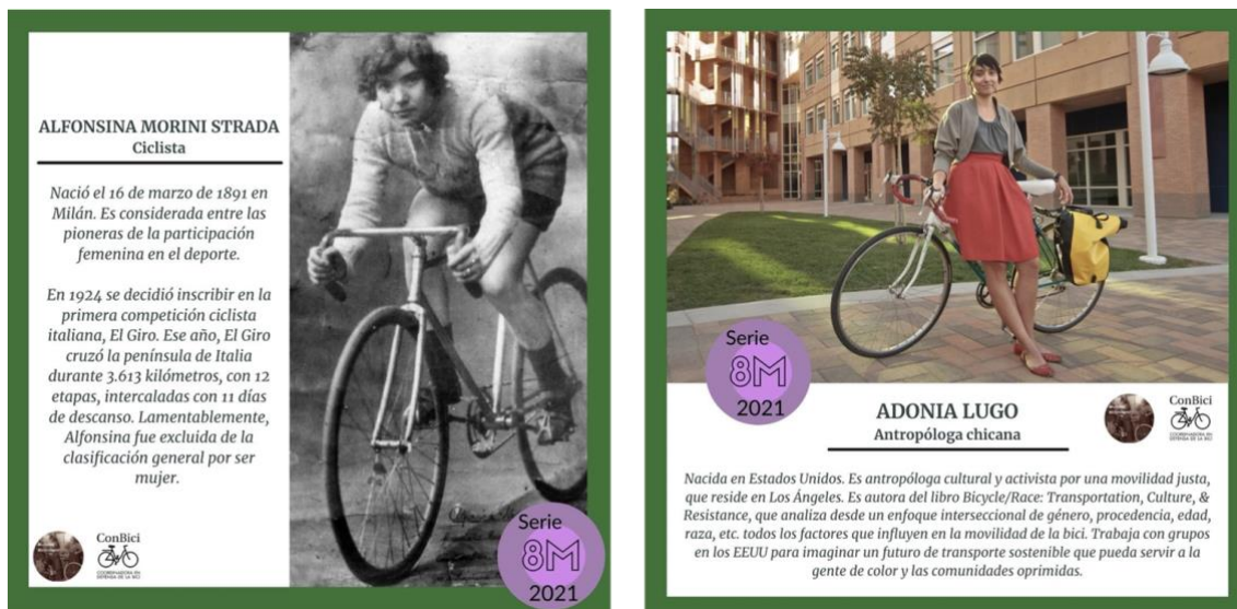
Figuras 7 y 8. Campaña de referentes de ConBici. (ConBici)