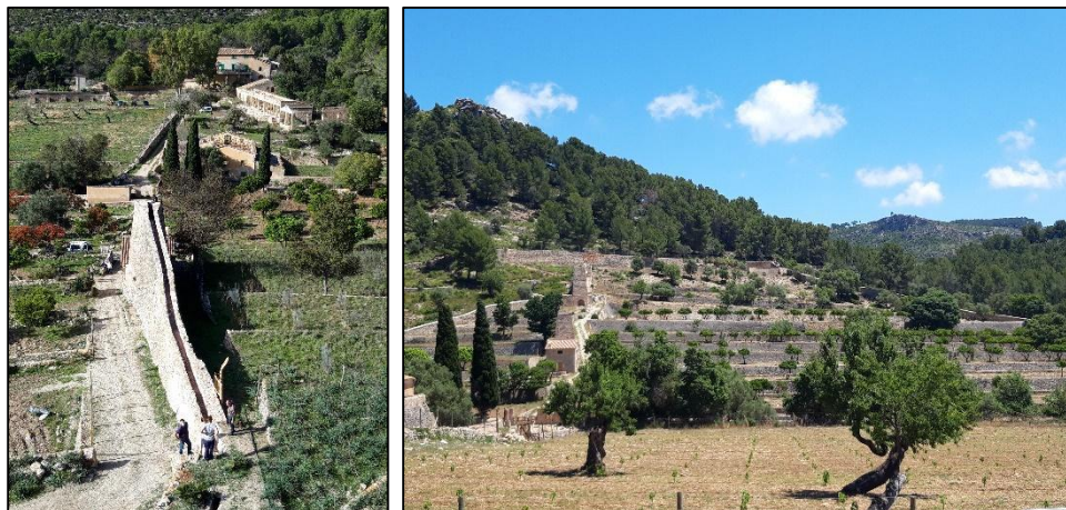
Figura 13. Detalle del molino (izquierda) y vista general de los molinos (derecha)

El agua de la acequia tiene una función doble: por un lado, regar las terrazas de cultivo, del conocido s'Hort des Tarongers ; y, por otro, alimentar a los molinos hidráulicos para producir harina. El agua se canaliza hacia uno u otro elemento mediante un sistema de compuertas. Esta combinación de regadío y molinos proporcionó gran prosperidad en la finca.