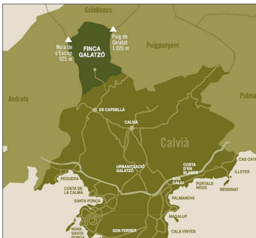
Figura 1. Situación de la Finca

El Ayuntamiento de Calvià es propietario de la finca Galatzó desde su adquisición en el año 2006. La Finca Pública Galatzó se sitúa en la isla de Mallorca, al norte del municipio de Calvià, en las proximidades del núcleo urbano de Es Capdellà. Limita con los términos de Puigpunyent, Andratx y Estellencs. Con sus 1.400 hectáreas, es una de las fincas de mayor extensión de las Islas Baleares. Su superficie corresponde, aproximadamente, a un 10% del territorio del municipio de Calvià. La finca está documentada en el año 1.283, donde una antigua alquería musulmana ocupaba este valle.