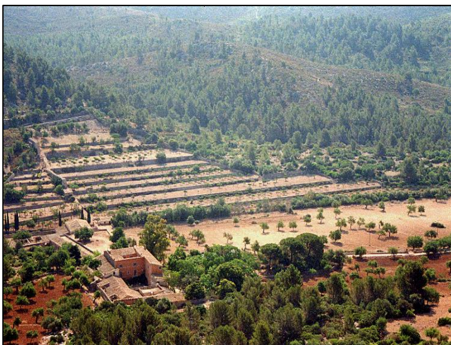
Figura 9. Área de regadío

Para el mantenimiento de los frutales existentes en la finca se llevarán a cabo las tareas necesarias para obtener frutos de calidad, aumentando la productividad existente, siguiendo siempre los principios reglamentados por Agricultura Ecológica.