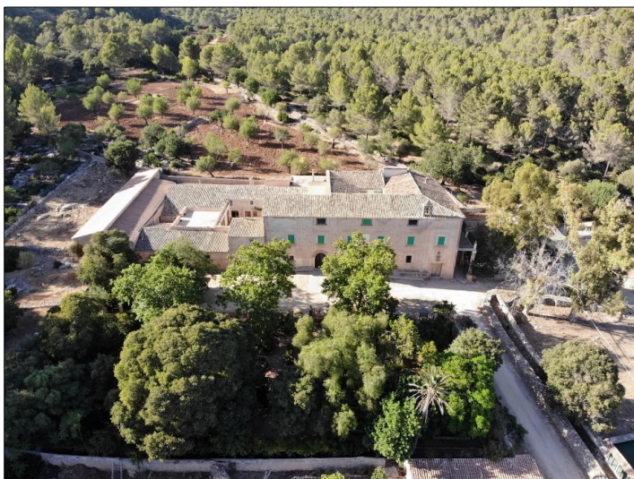
Figura 2. Conjunto arquitectónico principal de la Finca Pública Galatzó

La Serra de Tramuntana, donde está ubicada la finca pública de Galatzó está declarada como Patrimonio de la Humanidad por la UNESCO, desde el año 2007, Paraje Natural, por la riqueza y diversidad de sus paisajes, con zonas boscosas formadas por encinares, pinares y otras especies vegetales, que se alternan con espacios agrícolas dedicados al cultivo del olivo en bancales, o cítricos y almendros en los valles como es el caso de la Finca Pública Galatzó. Por ello la conservación de la biodiversidad y el paisaje de la Finca pública Galatzó es fundamental para garantizar y mantener este reconocimiento de la UNESCO como Patrimonio de la Humanidad.