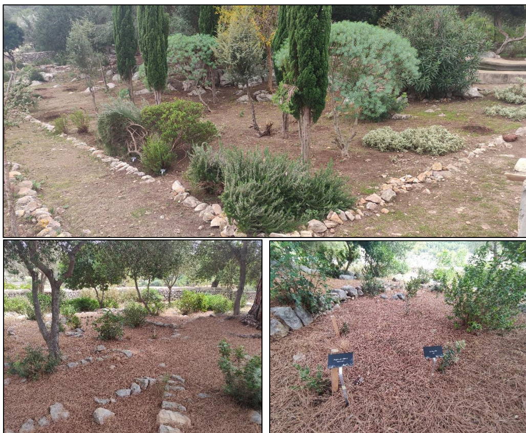
Figura 20. Vistas del jardín mediterráneo de la finca

Fruto de esta actuación, el jardín mediterráneo dispone actualmente de las 65 especies autóctonas más representativas y singulares de la finca Galatzó. El objetivo es que los visitantes y alumnos que nos visitan puedan familiarizarse con las especies más comunes y singulares, y que los más pequeños puedan la diversidad de plantas, sin necesidad de realizar los itinerarios de montaña de la finca, o bien llevar a cabo talleres infantiles que trabajan las texturas, olores, formas y la psicomotricidad fina.