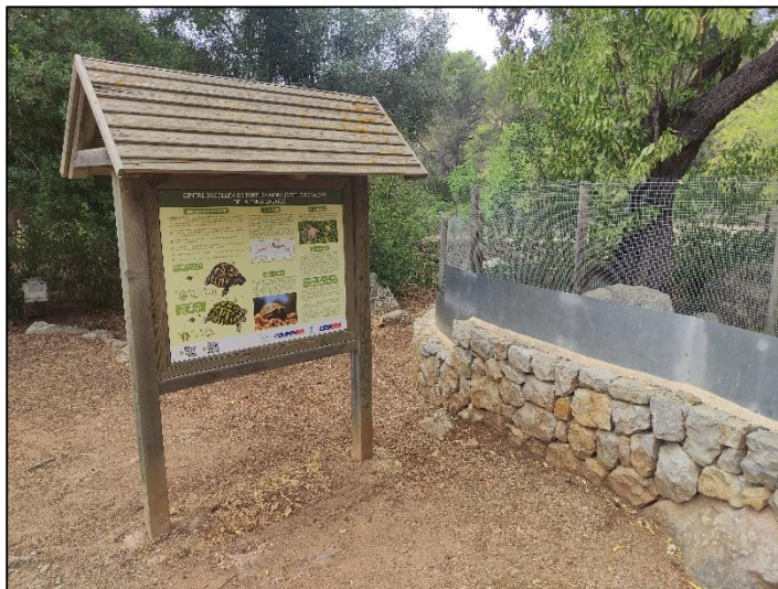
Figura 17. Centro acogida tortuga mora ( Testudo graeca )