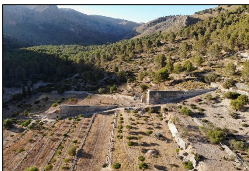
Figura 5. Molinos Hidráulicos y s'Hort des Tarongers