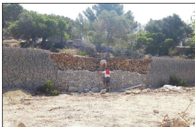
Figura 16. Detalle restauración pared piedra en seco.

Al mismo tiempo, hay que señalar el interés paisajístico de estas unidades de paisaje agrario típico de los municipios de la Serra de Tramuntana y, por tanto, también de la finca pública Galatzó.