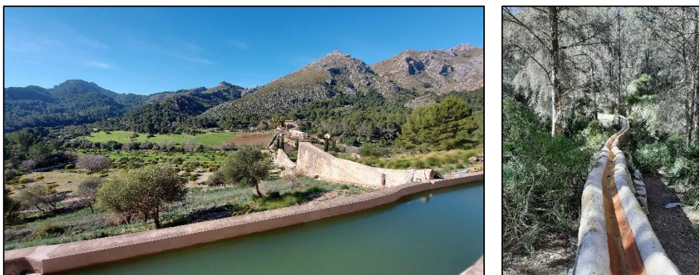
Figura 12. Detalle de la balsa (izquierda) y un tramo de la acequia de la fuente des Ratxo (derecha)