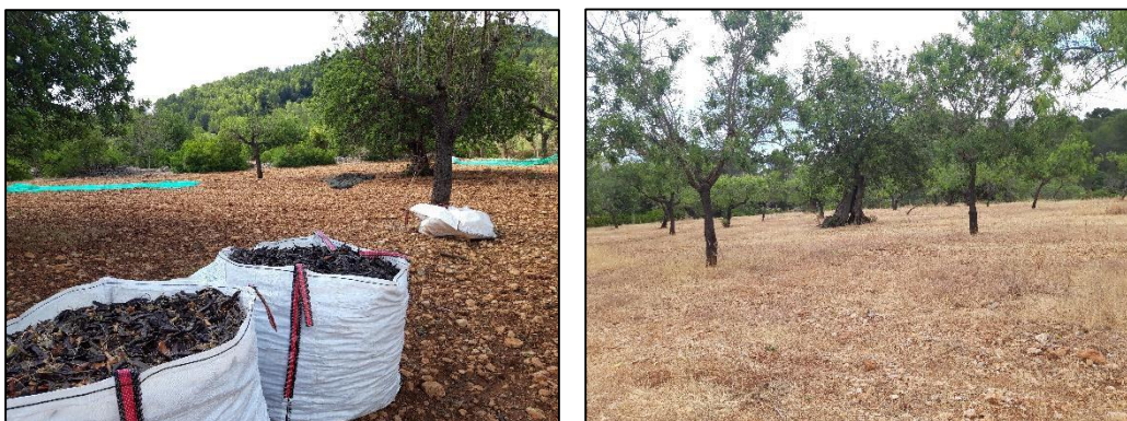
Figura 8. Detalle del cultivo de secano