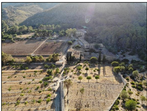
Figura 3. Vista de las parcelas agrícolas