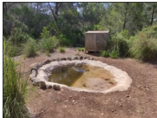
Figura 18. Observatorio de aves