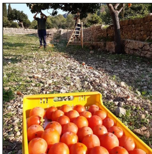
Figura 10. Detalle recogida frutos

Se han planificado nuevas plantaciones priorizando variedades locales tradicionales con valor gastronómico que se adapten a las condiciones de clima y suelo, y que permitan su transformación en productos elaborados. Se han recuperado algunos de los ejemplares existentes con técnicas de poda de rejuvenecimiento e injertos. Y se ha planificado nuevas plantaciones, priorizando la utilización de variedades de cítricos tanto para consumo en fresco como para la elaboración de productos transformados y que favorezca un calendario de recolección lo más amplio posible para que las recolecciones se escalonen en el tiempo y la disponibilidad de los frutos sea la mayor posible.