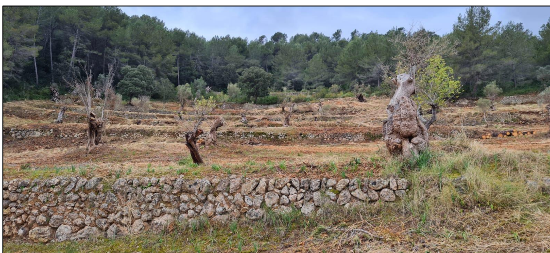
Figura 7. Vista de los bancales d' Es Tramuntanal

En la misma línea, también se ha recuperado una antigua zona de cultivo de secano (algarrobos e higueras) en la zona conocida como Font de sa Cometa de 3,5 ha.a. Junto a esta y las recuperaciones de las zonas de olivares de Na Llaneras y Es tramuntanal , se han recuperado un total de 11,5 ha. de espacios agrícolas degradados y abandonados hasta ahora.