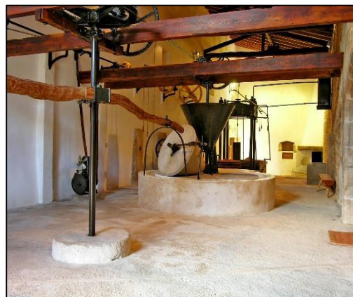
Figura 14. Almazara Finca de Galatzó

Estas actuaciones se incluyen dentro de los objetivos de la gestión de la finca pública Galatzó; llevar a cabo una gestión por el mantenimiento, recuperación y mejora de sus espacios agrícolas ganaderos y forestales, además de promover la conservación, la restauración, la mejora y la puesta en valor del patrimonio histórico y etnológico.