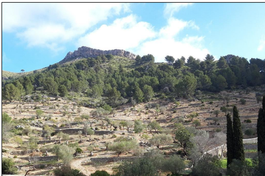
Figura 6. Vista de los bancales de Na Llaneras