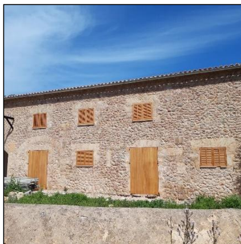
Figura 15. Fachada principal vaquería

Además, la actuación de rehabilitación propuesta, permitirá recuperar un elemento arquitectónico y, entre otros, convertirlo en un elemento esencial en la explotación agropecuaria, con almacén agrícola tanto para productos de la cosecha, como maquinaria y herramientas.