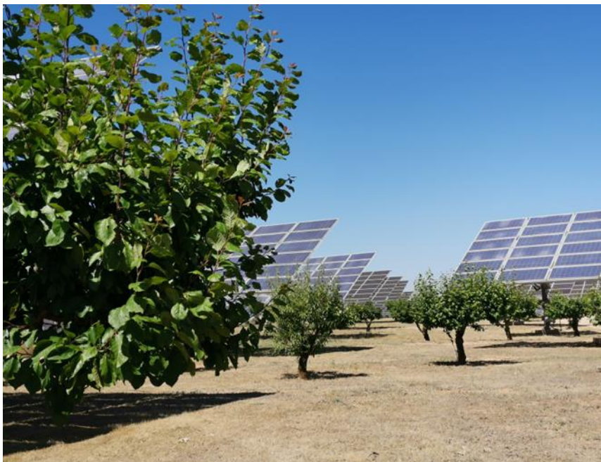
HUERTO LOS HITOS 1'8 MW