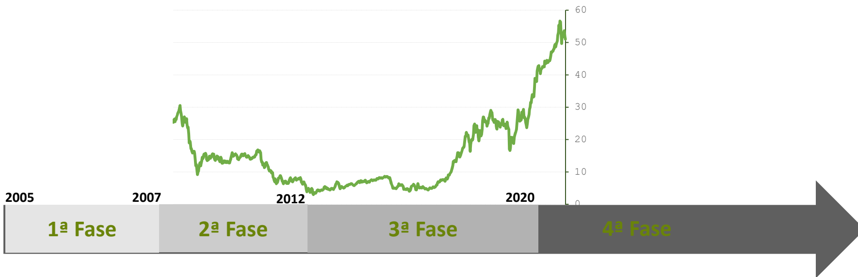
Precio diario del mercado de carbono ETS de la UE (€/t CO2)