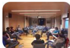
SESION 3 Participación