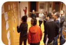
SESION 1 Principios y valores