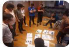
SESION 4 Preparación visita