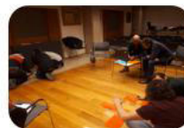
SESION 1 DAFO grupal