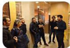
SESION 2 Identificación de Agentes