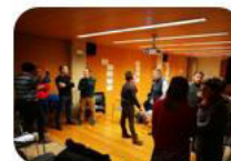
SESION 3 Flujograma de acciones