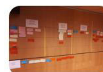
SESION 4 Cronograma y agenda