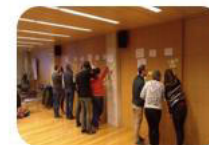
SESION 2 Comunicación y sensibilización