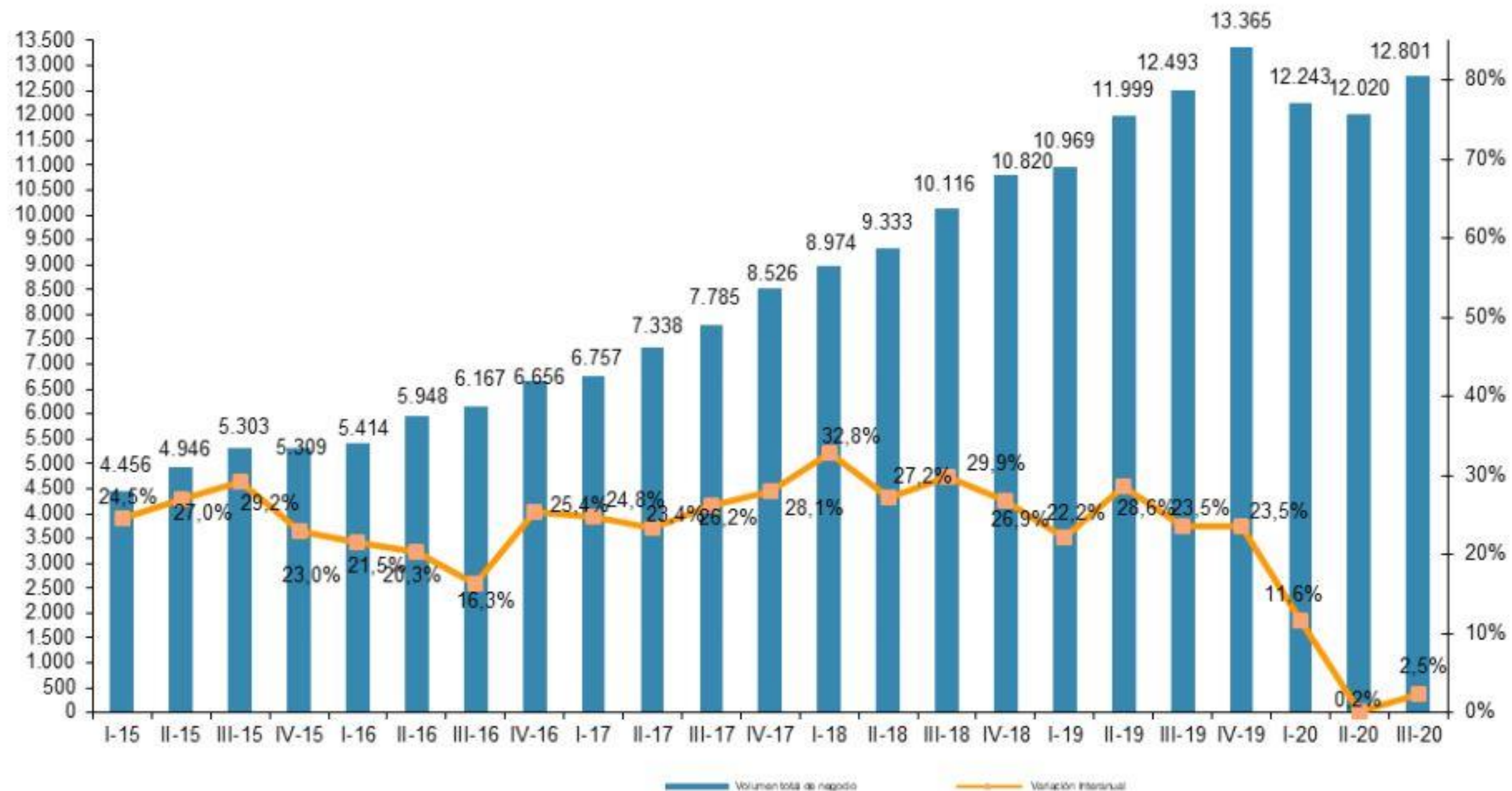
EVOLUCIÓN TRIMESTRAL DEL VOLUMEN DE NEGOCIO DEL COMERCIO ELECTRÓNICO Y VARIACIÓN INTERANUAL (millones de euros y porcentaje)