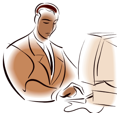
Figura 1. Ejemplo de figura.