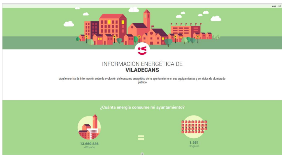
Figura 1. Portal energético del Ayuntamiento de Viladecans.

Con la publicación del portal energético, el Ayuntamiento pone a disposición pública esta información de consumo de los equipamientos municipales en un formato visual e inteligible cuyos datos se actualizan mensualmente.