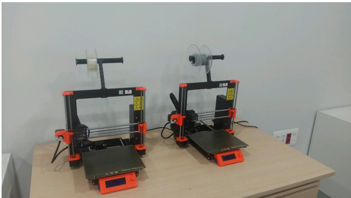
Figura 3. Impresoras 3D en el laboratorio de reparación en el edificio PRAE (Proyecto Circular Labs).