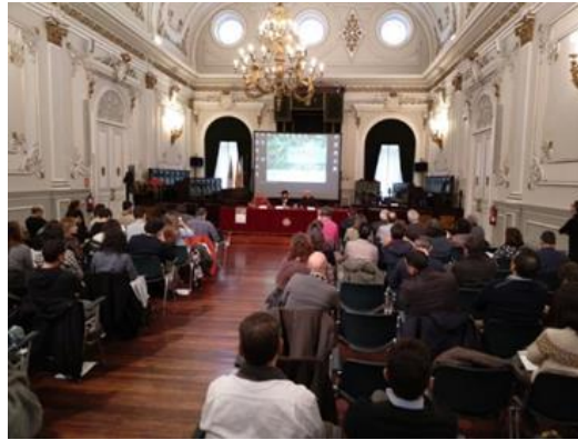
Figura 10. Seminario Internacional Diputación Pontevedra. (CEIDA)