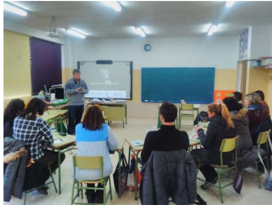
Figura 3. Apoyo a los centros educativos (CEIDA)