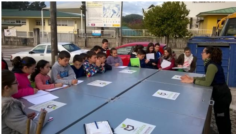
Figura 1. Visita a compostero comunitario (CEIDA)

Además, incluye los siguientes objetivos específicos: