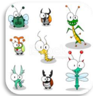
Figura 8. Actividades educación infantil. (CEIDA)