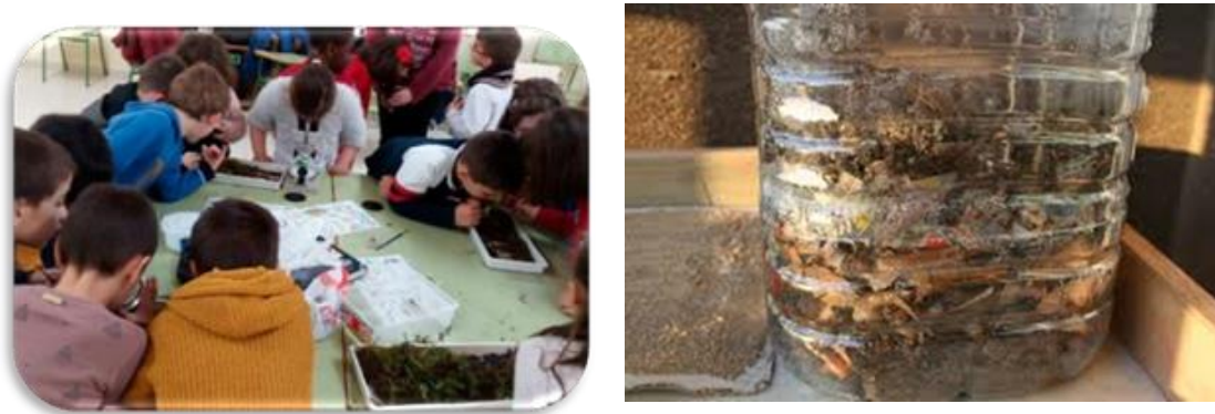
Figura 9. Actividades educación primaria y secundaria. (CEIDA)

Consiste en visitar el centro de compostaje comunitaria más próximo al centro educativo. Esta visita sería guiada con las explicaciones del equipo educativo.