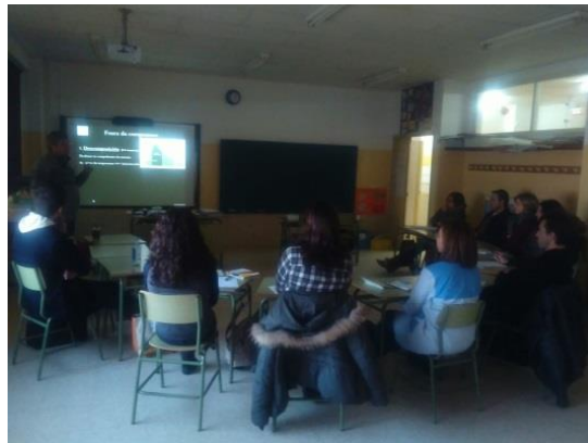
Figura 5. Formación del profesorado. (CEIDA)

Esta actividad está dirigida al profesorado de enseñanza primaria y secundaria. Consiste en la realización de una jornada formativa de, aproximadamente, tres horas en las que se intenta el acercamiento del profesorado al tema del compostaje y a su aprovechamiento como recurso didáctico.