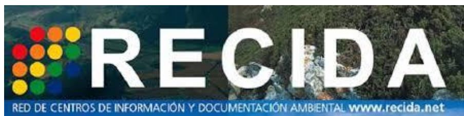
Figura 6. Logo RECIDA. (CENEAM)

Este Centro forma parte de una red estatal, RECIDA (Red de Centros de Información y Documentación Ambiental) que reúne diferentes unidades de información, representantes de 14 autonomías del estado español.