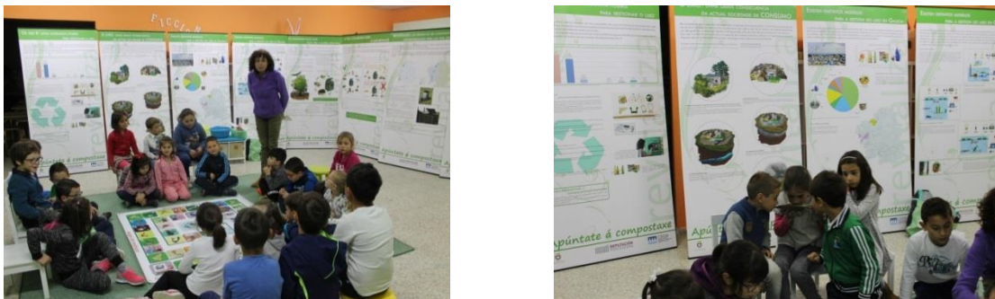
Figura 7. Exposición itinerante. (CEIDA)

Vinculado a esta exposición, el programa ofrece una serie de talleres que ayuden a afianzar los conceptos que muestra la exposición.