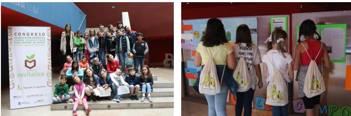
Figura 4. Celebración congreso de educación ambiental (CEIDA)

El CEIDA lleva desde el año 2007 celebrando Congresos Escolares de muy distintas temáticas. Estos Congresos fueron concebidos, desde el primer momento, con el objetivo de brindar a los centros educativos un espacio de intercambio de experiencias y un punto de encuentro en el que incentivar a nuevos centros a que trabajen en la conservación y divulgación del medio natural. Así mismo, se busca dar protagonismo al alumnado para que se conviertan en los portavoces de la realidad ambiental de su ámbito más próximo.