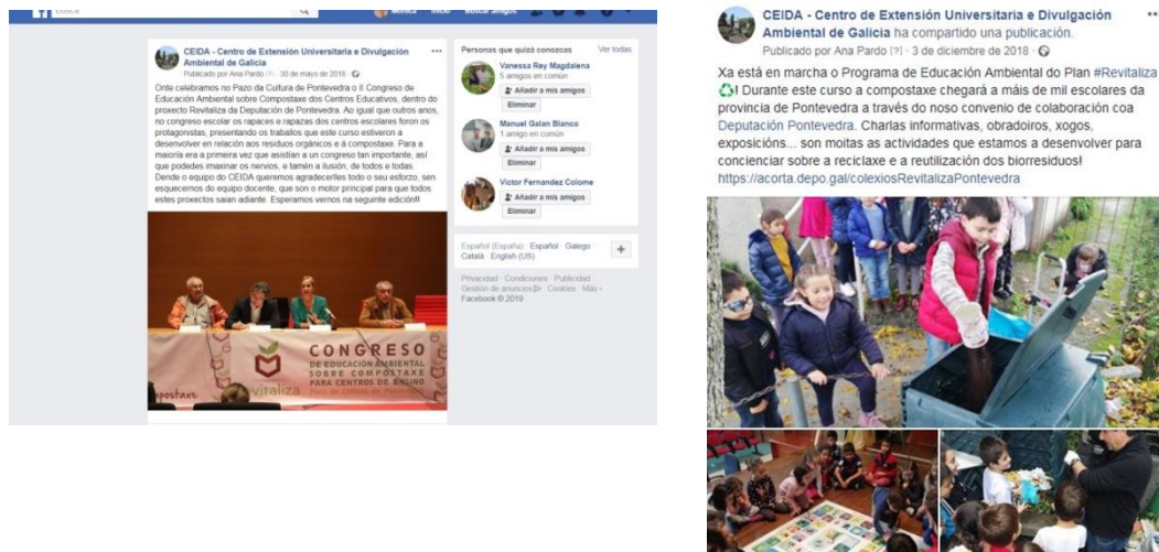
Figura 11. Divulgación en redes sociales del CEIDA. (CEIDA)

En esta estrategia divulgativa, se hace uso de los diferentes canales de difusión que el propio CEIDA posee (Facebook, twitter, youtube...), con el objetivo de hacer llegar diferentes formatos y contenido (imágenes, vídeos, artículos etc) al mayor número de destinatarios posibles. También se comparte toda la información con otras instituciones relacionadas con el ámbito de actuación del CEIDA o entidades colaboradoras.