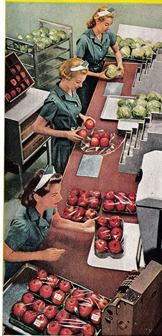
IN THE PACKAGING ROOM

— and see why fruits and vegetables packaged in cellophane are your best buy!