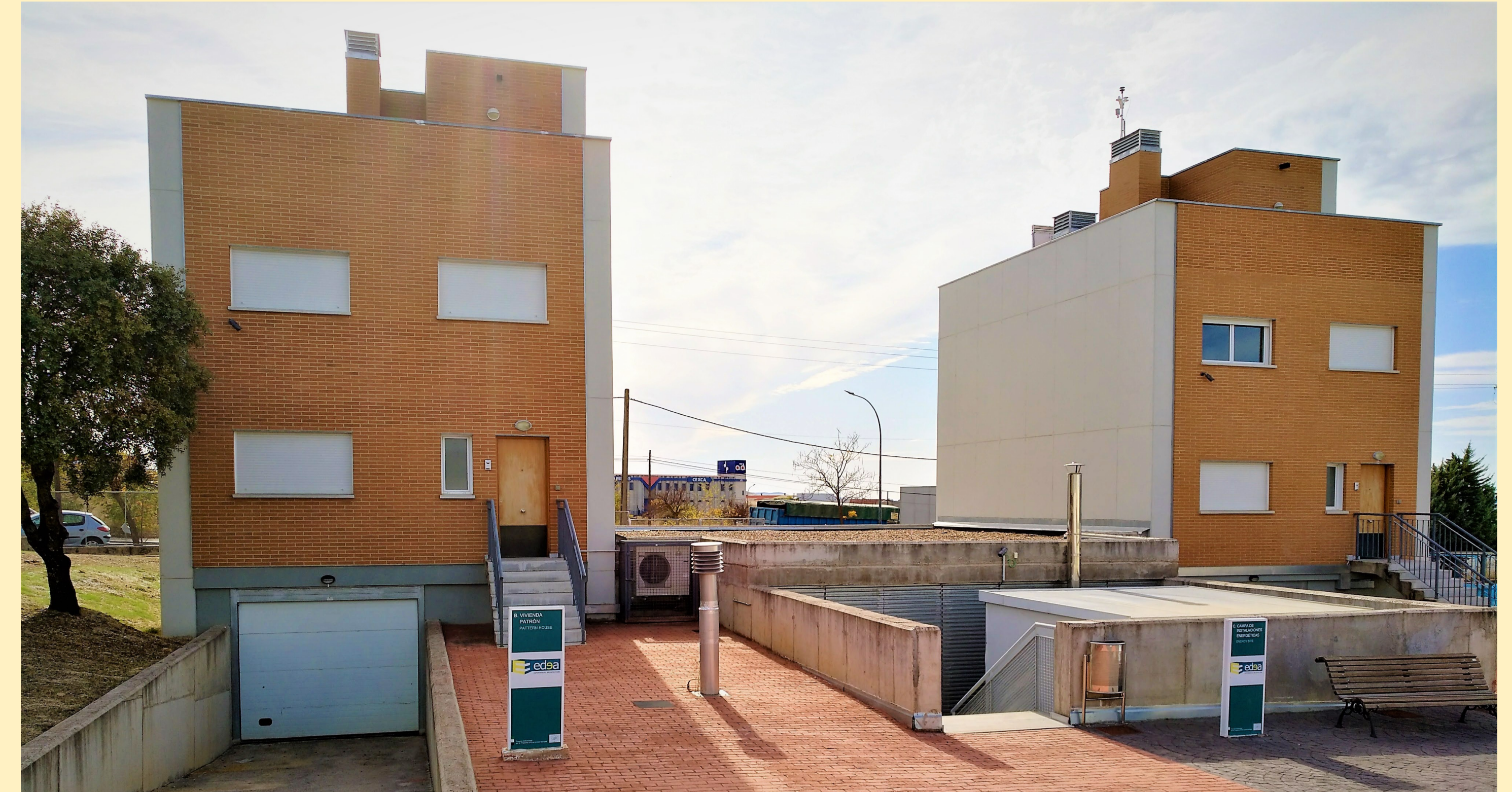
Figura 1: Vista frontal de las viviendas experimentales

Los Demostradores EDEA-CICE están totalmente dotados de equipos de medida y control y están disponibles a investigadores y empresas al ser uno de los 6 demostradores que existen en toda Europa. Esta facilidad para ensayar diferentes estrategias permite estudiar modelos reales de Edificios de Consumo Energético Casi Nulo (ECCN) .