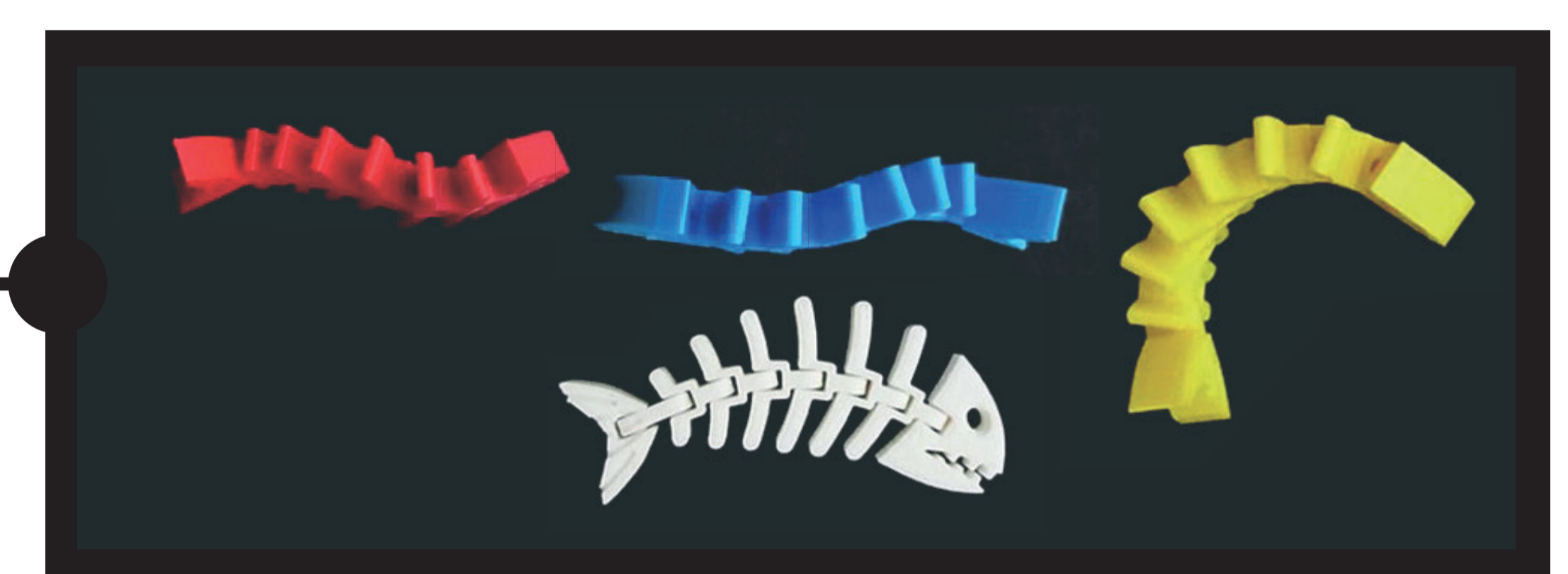
Pez fósil super flexible (Prototipo producto final)

Como punto final del proceso, el material recogido será procesado y analizado en las plantas piloto de AIMPLAS para la fabricación de producto final.