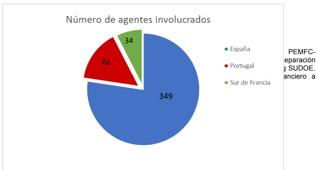
Figura 2. Distribución de los agentes implicados en el sector

Dentro del contexto del proyecto PEMFC SUDOE se ha creado una base de datos con más de 440 agentes involucrados en el sector del hidrógeno y las pilas de combustibles. Estos agentes se pueden filtrar por zonas, regiones, áreas geográficas, tipo de organización según su actividad (empresa o centro de investigación y desarrollo) y su participación en el sector del hidrógeno o la capacidad de penetración en el mercado.