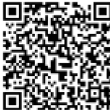
Figura 4. Código QR de la herramienta interactiva