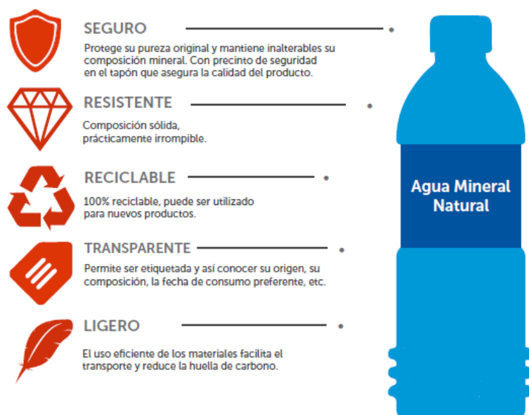
Funciones del envase de agua mineral.

Además, a través del envase se proporciona al consumidor la información necesaria acerca del producto, figurando entre otros su origen, su composición química o la empresa envasadora.