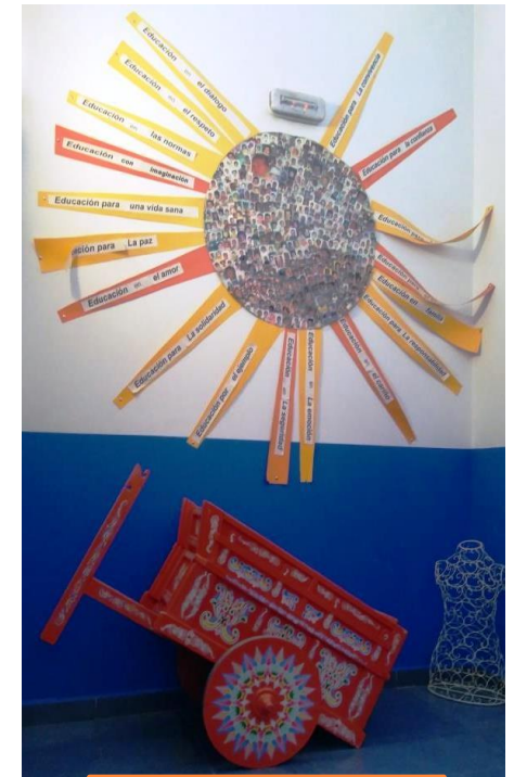
EEI El Sol

□ Apoyo en la elaboración de los pliegos para concurso público de la Escuelas infantiles de gestión indirecta del Ayto.