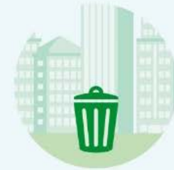
Biomosas domésticas (procedentes de residuos urbanos)