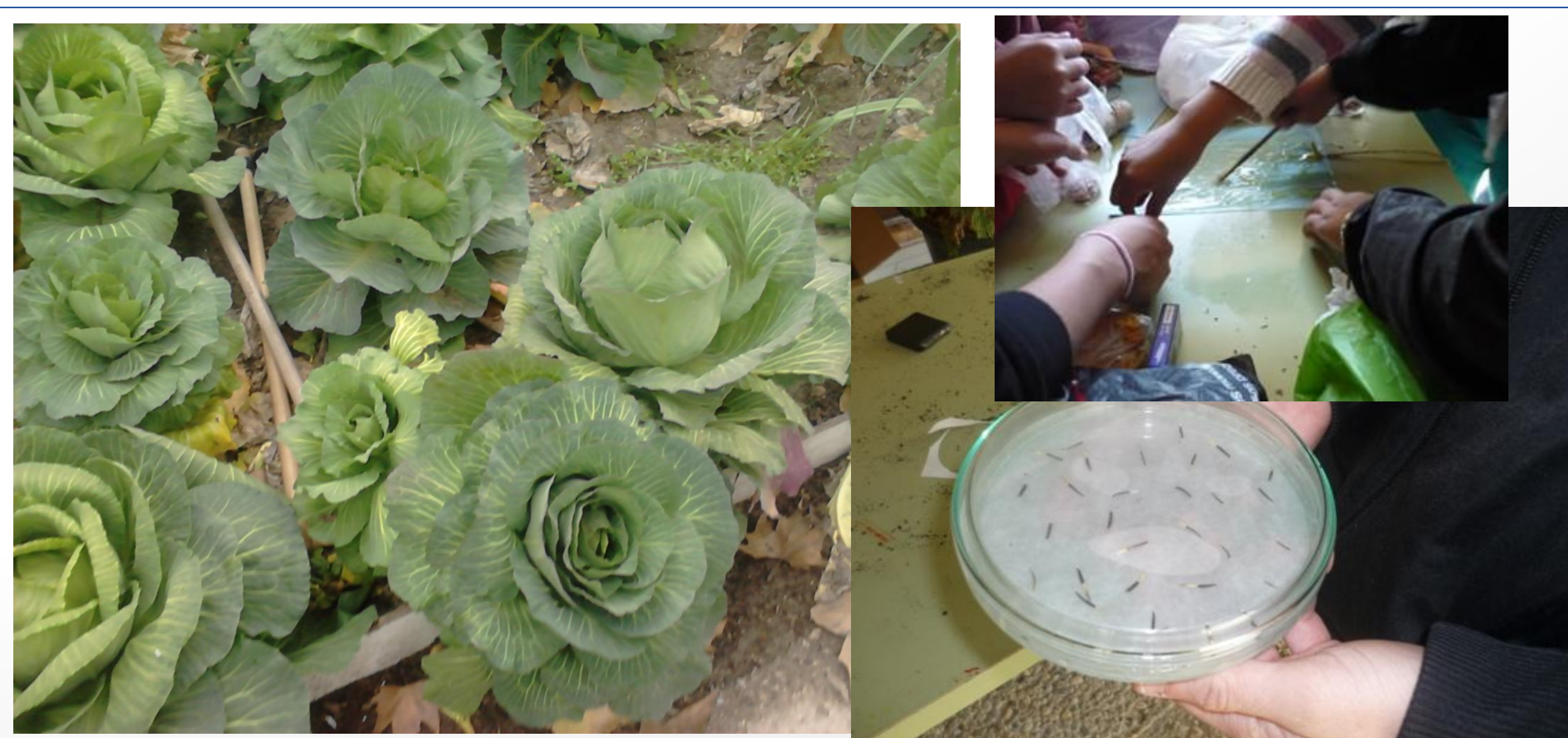
Imágenes de las sesiones celebradas en el I.E.S. Menéndez Pelayo