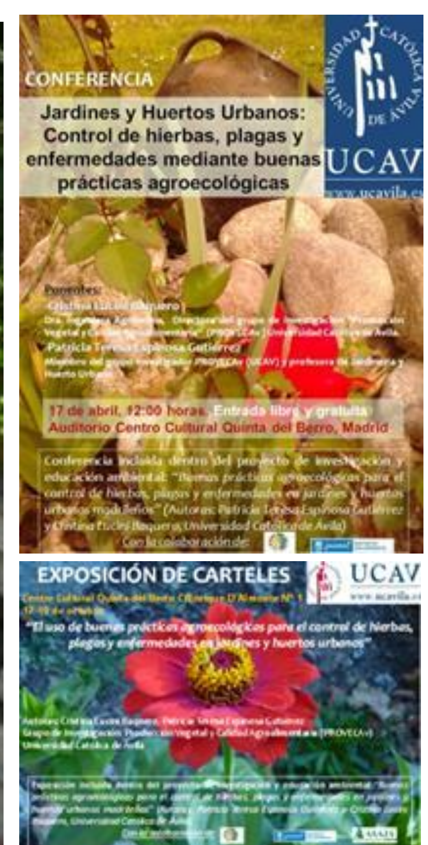
Escalinata principal del jardín del Centro Cultural Quinta del Berro (Madrid) junto con carteles de conferencias y exposición celebradas.