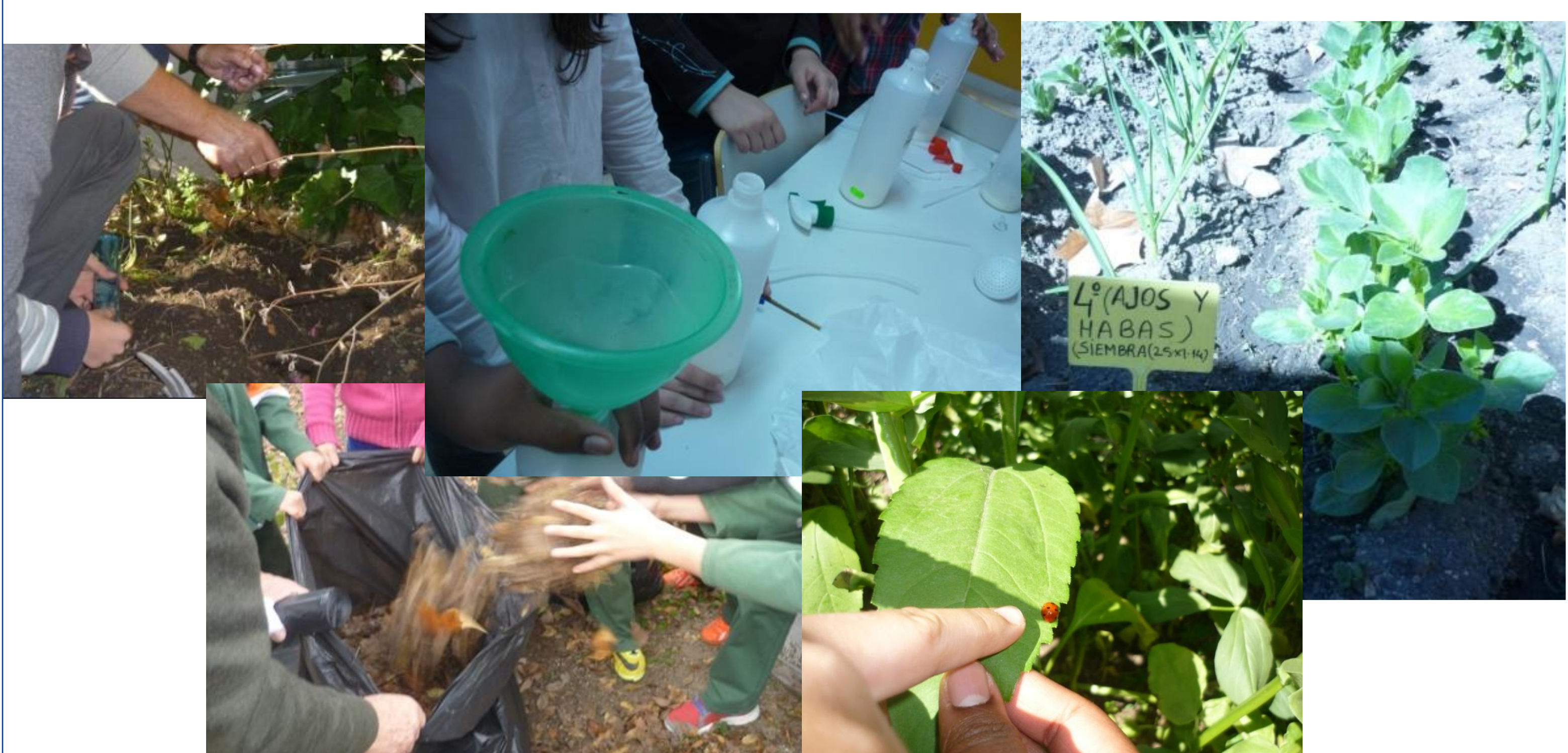
Imágenes de diferentes sesiones educativas celebradas en el Colegio Público Patriarca Obispo Eijo Garay