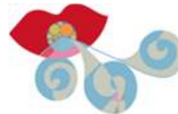
Desarrollo de Personas