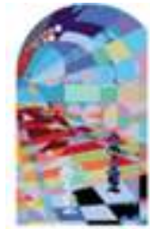
Gestión de la Innovación Empresarial