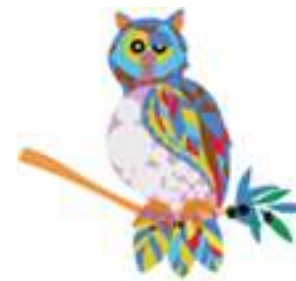
Sistema Regionales de Innovación