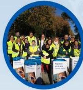
Premio "Empresa Social"