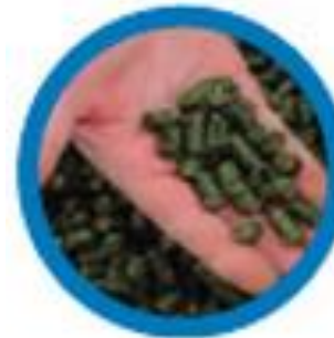
Deshidratación de alfalfa en Francia

En 2013 700.000 Toneladas de CO 2 compensadas