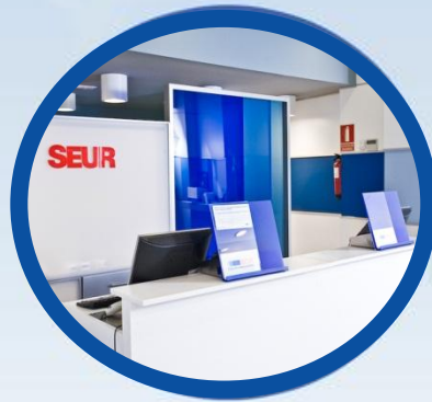
Entrega en tienda