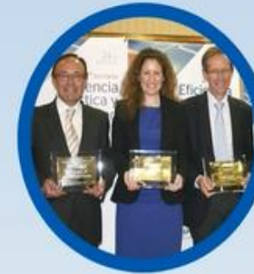
Premio a la "Eficiencia Logística y RSC" otorgado por Logística Profesional