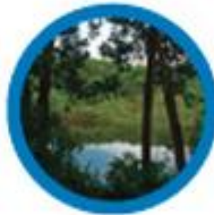
Reforestación en Colombia