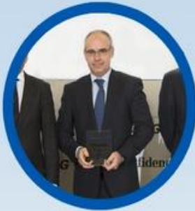
Premio KPMG-El Confidencial a las "Mejores Prácticas Empresariales" en ecoeficiencia