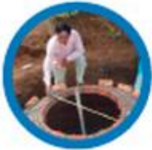
Programa Biodigestor en Camboya