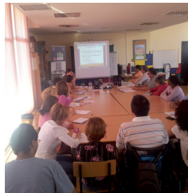
Grupo de Acción Local, Málaga.

En Málaga, el distrito Palma Palmilla fue elegido para ser la zona objeto de estudio. Málaga tiene una riqueza de experiencia en el trabajo en temas de sostenibilidad urbana y los proyectos que se centran en la transformación de las zonas deprimidas de la ciudad. Más específicamente, desde el año 2005, el Ayuntamiento de Málaga ha ido desarrollando y aplicando una metodología participativa, que promueve la participación democrática y la ciudadanía activa en Palma Palmilla, dentro del proyecto HOGAR y la aprobación del Plan Estratégico Integral para las barriadas de palma Palmilla. 1