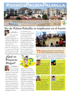
Ejemplo de newsletter local.

A través de su participación en este proyecto, el Ayuntamiento de Málaga y el Distrito de Palma Palmilla han abierto el barrio hacia Europa, teniendo de la oportunidad de revisar e "internacionalizar" el plan de acción local existente en el barrio y de aprender de otras ciudades europeas que se enfrentan a problemas similares. También se ha desarrollado un sistema de indicadores apropiado para medir el impacto y los avances del Plan de Acción, todo a través de un proceso participativo intenso e inclusivo. Con el fin de mantener a los residentes al día con las actividades del proyecto y llegar a más gente, se ha desarrollado un bulletin informativo.