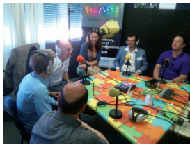
Embajadores del Conocimiento en la Radio Comunitaria de Palma Palmilla, Málaga.

También, y como resultado del conocimiento generado en el proyecto, se producirán unas recomendaciones políticas sobre la revitalización de estos entornos y unas líneas de gobernanza urbana inteligente.