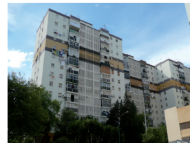
El entorno de Palma Palmilla.

La estructura participativo consiste en la organización de 12 grupos de trabajo en las siguientes áreas: Educación, Juventud y Comunicación. Los grupos de trabajo están abiertos a la participación de todos. Un denominado Grupo de Acción Local fue creado que consistió en representantes de cada uno de los grupos de trabajo temáticos. Este grupo de acción Local es la figura clave en el desarrollo del plan de acción local y el factor común entre los 10 socios europeos del proyecto. Sus principales tareas incluyen la aprobación de las propuestas realizadas por las mesas de trabajo y la coordinación general de proceso participativo.