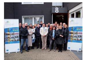
Reunión de proyecto en Gelsenkirchen, Alemania.

Por último, se está trabajando en la alineación de las propuestas realizadas con fondos europeos y el desarrollo de proyectos "Spin-off" con las otras ciudades socias del proyecto. Estas medidas asegurarán la colaboración transnacional continua con otras ciudades así como el aprovechamiento de todas las fuentes de financiación existentes a nivel europeo, nacional, regional y local, para la implementación exitosa del Plan de Acción Local.