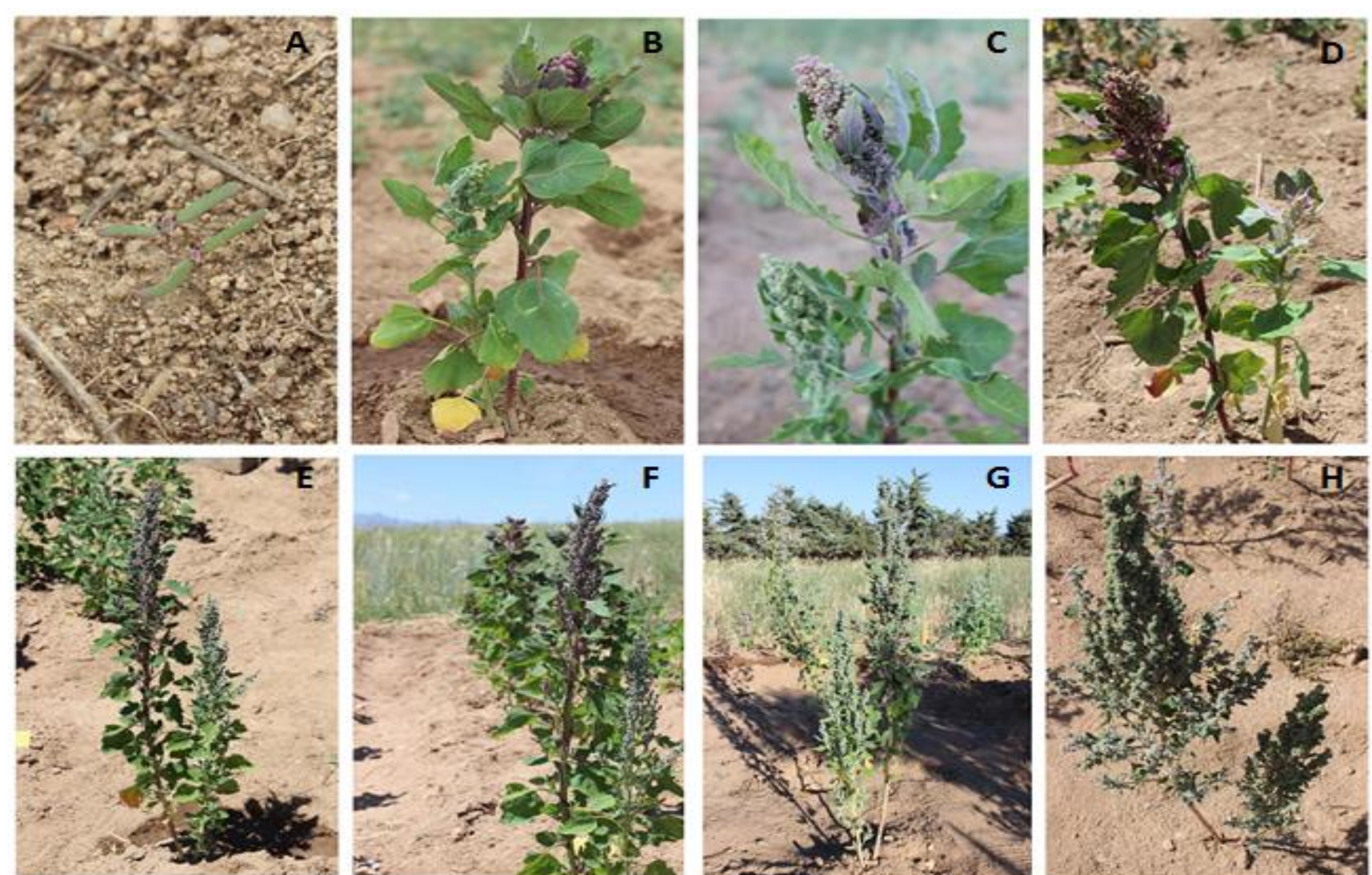
Figura 3. Fotografías del desarrollo de dos plantas pertenecientes a la variedad Chenopodium quinoa Willd. Perlada Tricolor en la parcela I (La Colilla). A) Día 12 después de la siembra (dps); B) 59 dps; C) 67 dps; D) 70 dps; E) 87 dps; F) 98 dps; G) 107 dps; H) 151 dps.