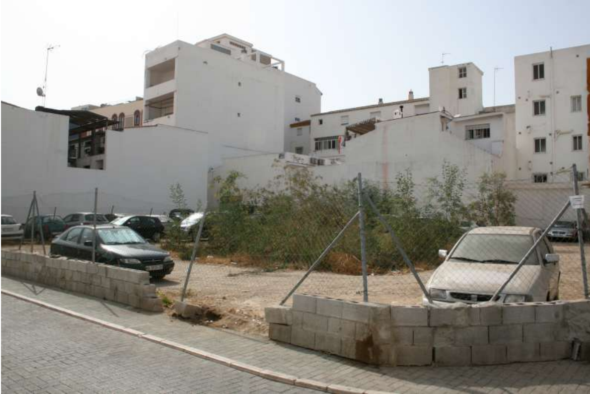
Solar en el entorno Plaza San Pablo