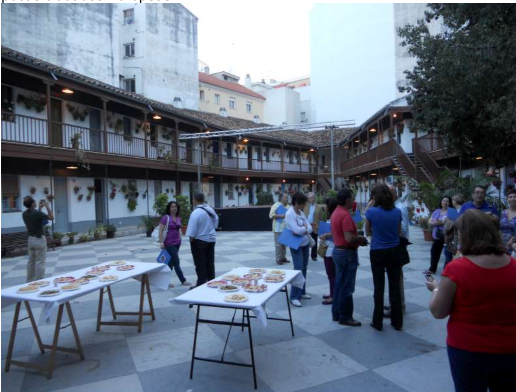
Corralón de Santa Sofía-Entrega de premios de fiestas populares

Estos barrios se caracterizan por la arquitectura tradicional llamada “Corralones” formados por un número de viviendas, que comparten sus accesos a través del mismo patio común (popularmente conocido como “Patio de vecinos”). Se trata de ejemplos de una relación espacio público-privada muy particular y que actualmente se mantiene en pocas ciudades Europeas.