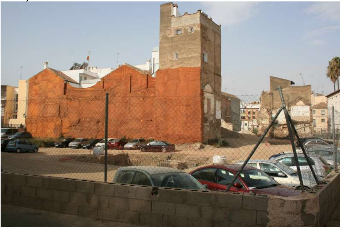
Solar usado como aparcamiento