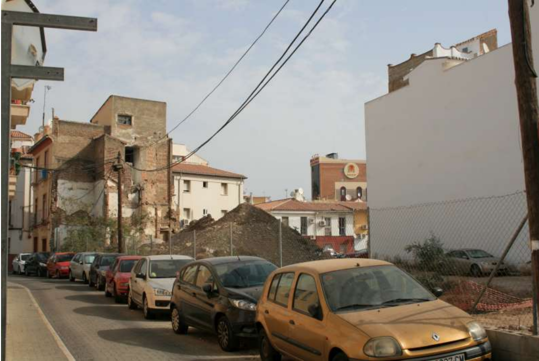
Ruinas y solar en el Perchel Norte