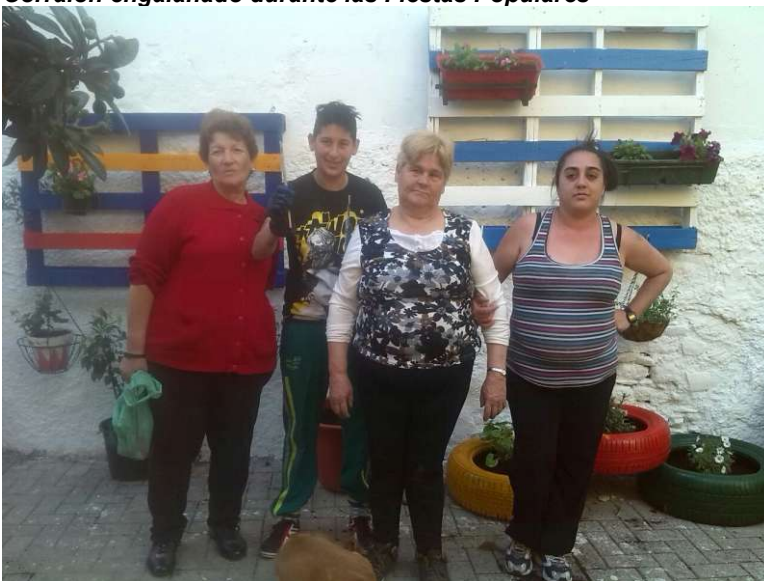
Taller de Manualidades con vecinos en los Corralones