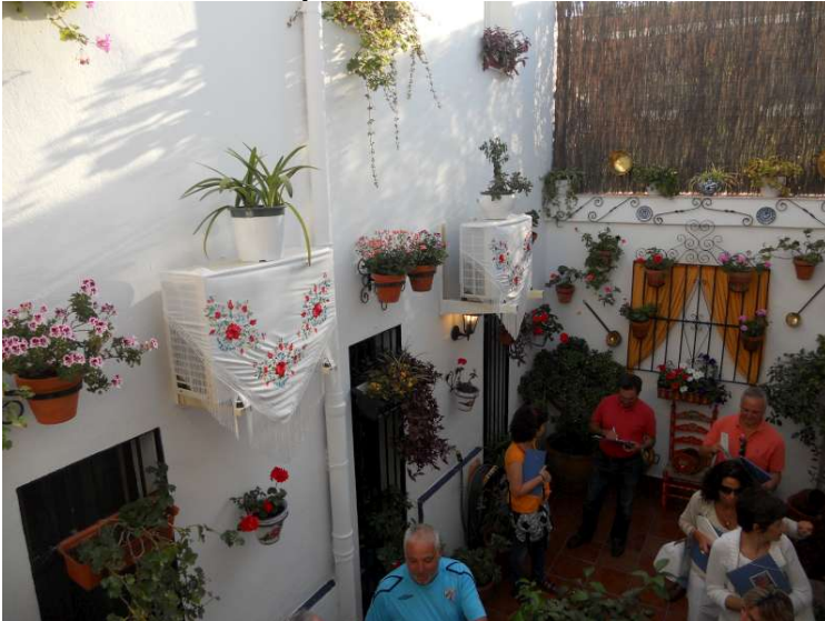
Corralón engalanado durante las Fiestas Populares

El espíritu del proyecto, es hacer partícipe a los usuarios del espacio público, su responsabilidad en el mantenimiento, diseño, gestión y disfrute de los mismos, de forma similar a los patios de “los Corralones” en los que habitan.