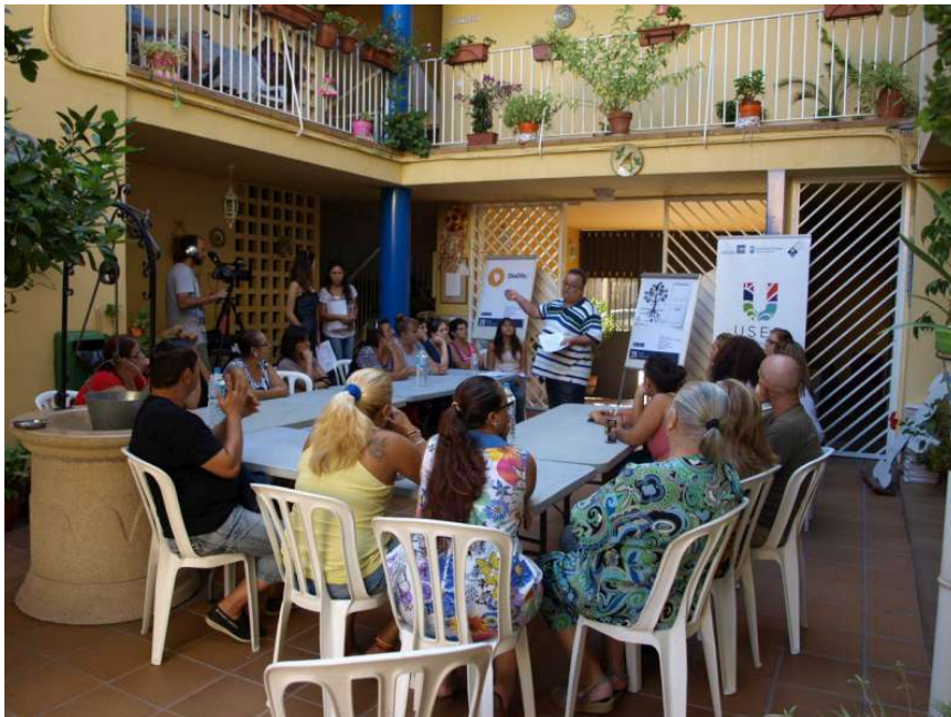
Reunión vecinos en Perchel Norte

El marco de trabajo se ha consolidado como instrumento de trabajo participativo y un proceso de toma de decisiones consensuada a nivel local. Esta hoja de ruta, es compartida a nivel internacional, ya que todos los nueve socios de la Red USER URBACT han seguido el mismo esquema de trabajo, adaptándolo a las peculiaridades de la gobernanza municipal en cada ciudad.