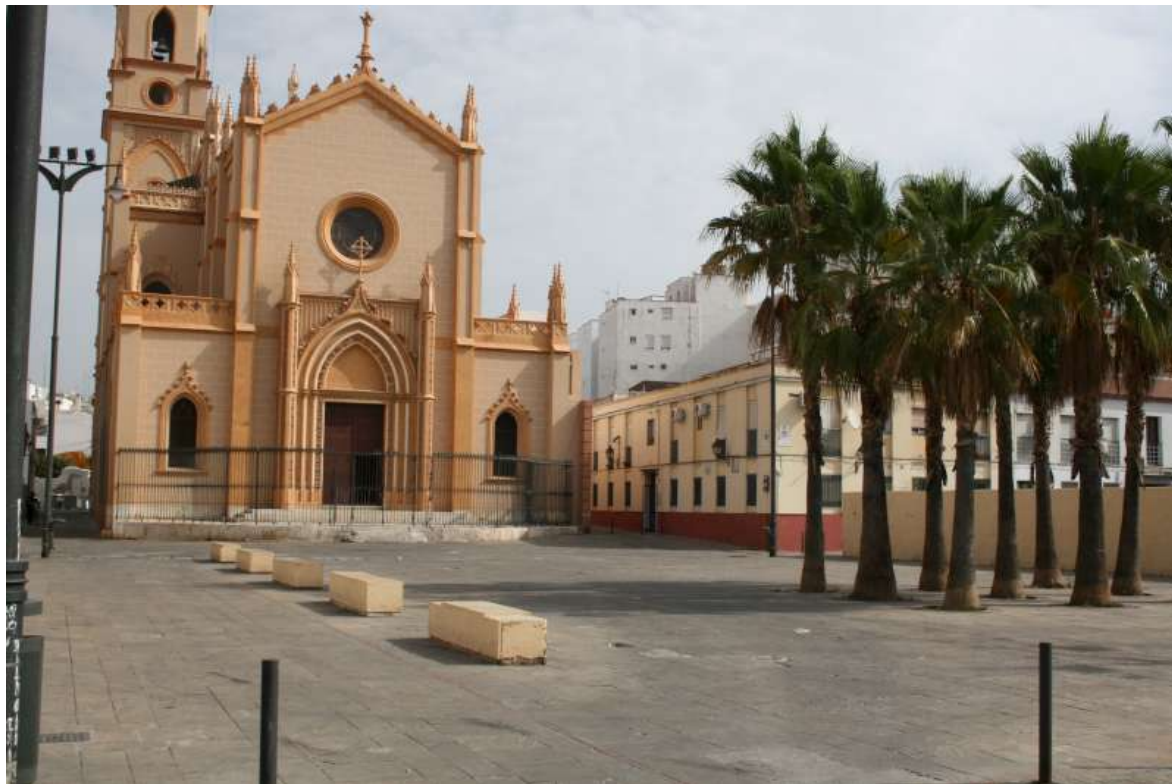
Plaza San Pablo

Puede tener un papel de “Plaza Mayor de La Trinidad”, tanto por su ubicación central como por la relevancia arquitectónica de la Iglesia y la imagen de Jesús El Cautivo. Tiene buena accesibilidad y conectividad con el resto del barrio y sus principales vías, aunque existe un importante suelo sin consolidar que puede favorecer nuevos usos. La presencia en los alrededores de corralones de excelencia puede suponer otro elemento de atracción que otorga valor añadido al entorno.