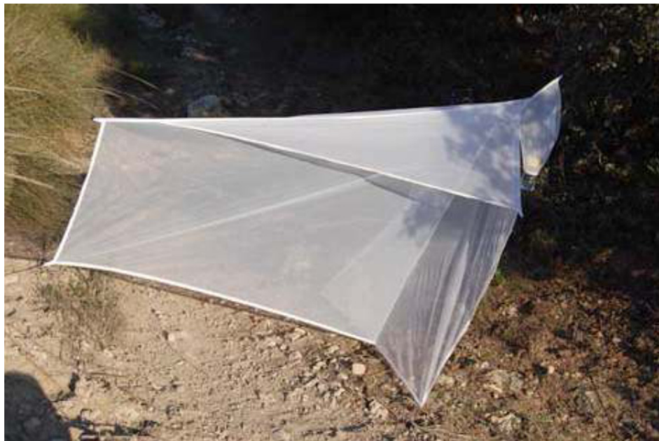
Imagen 1: Trampa Malaise para la captura de insectos.

Se trata del grupo faunístico responsable de la polinización de casi el 99% de las especies vegetales, entre los que encontramos las familias de: