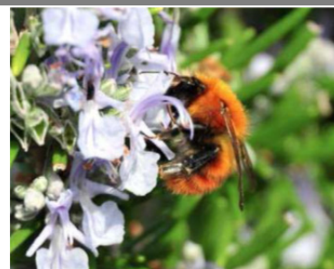
Imagen 3: Insecto polinizador sobre la flor de una labiada