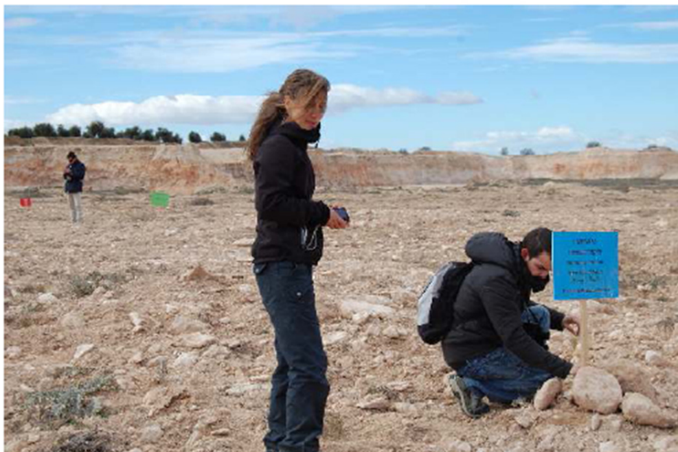
Imagen 5: Técnicos del proyecto realizando la colocación de la cartelería tras la realización de las siembras.