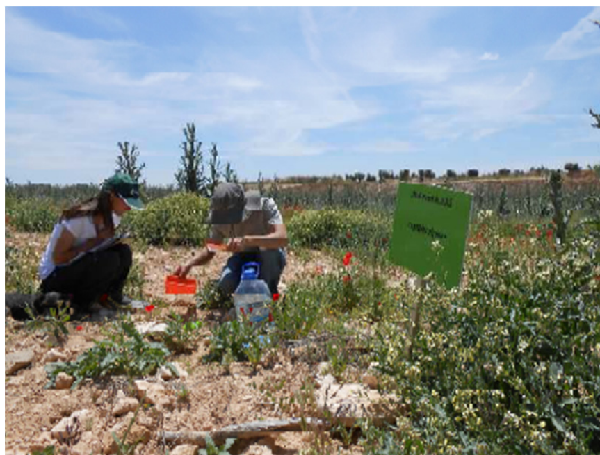
Imagen 2: Técnicos del proyecto realizando el censo de insectos polinizadores en las zonas plantadas con especies vegetales silvestres

LÍNEA DE TRABAJO 3: Este proyecto no se puede desligar, en su diseño o aplicación, del objetivo de lograr una COMUNICACIÓN EFECTIVA DE TODAS LAS ACCIONES EN CONSERVACIÓN DE LA NATURALEZA Y RESTAURACIÓN DE CANTERAS desarrolladas por Lafarge, un grupo que se preocupa por hacer sostenible y compatible con la conservación del medio ambiente su explotación.