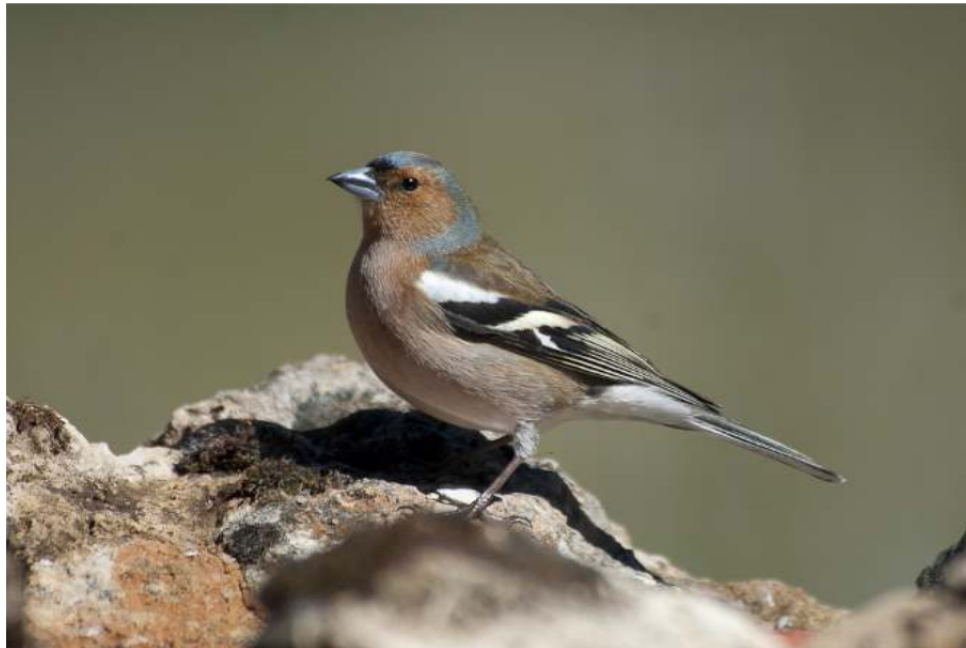
Imagen 4: Pinzón ( Fringilla coelebs )

Para ello, a lo largo de los años, en una segunda fase, vamos a sembrar en zonas que ya están plantadas con especies leñosas ( Genistas , Centaureas y Thymus ) con especies gramíneas y flores silvestres como Plantación tipo , y poder calcular de forma más matemática sus rendimientos. Esta Plantación tipo es exportable a zonas agrícolas en las que las variaciones pueden ser, simplemente, subespecies de determinados géneros o alguna singularidad biológica de determinados hábitats y localizaciones.